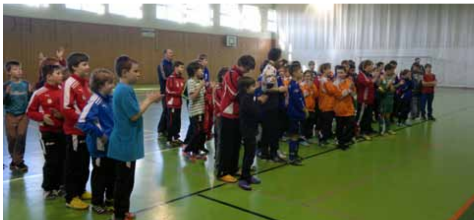
Námi organizovaný halový turnaj mladších žáků v Třebíči.

K tomuto je zapotřebí i dostatečný počet trenérů. Proto prosíme i tatínky dětí a další zájemce z řad veřejnosti o trénování. Máte-li chuť, přijďte a pomozte při organizaci a trénování. Vše děláme pro děti a máme radost z jejich pohybu i úspěchů. Můžete se s námi o tuto radost podělit.